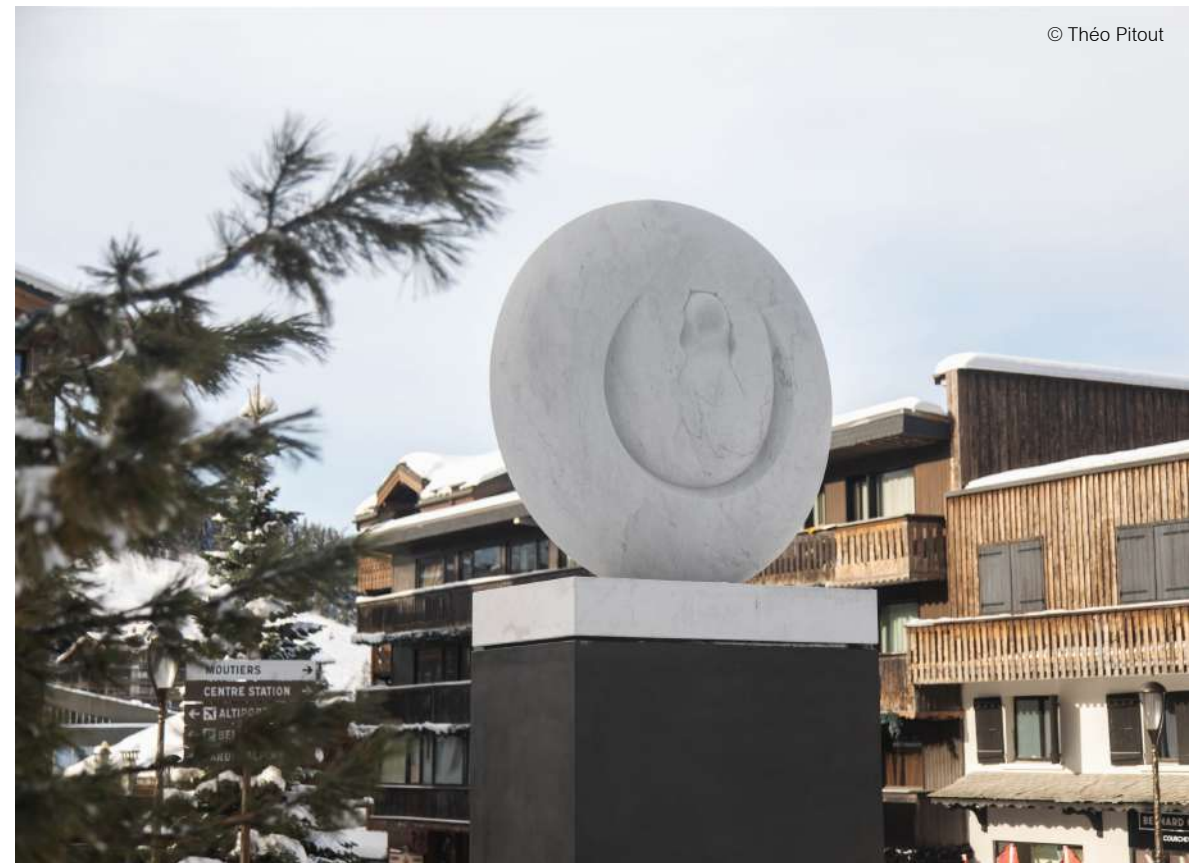
« MISTERIO »