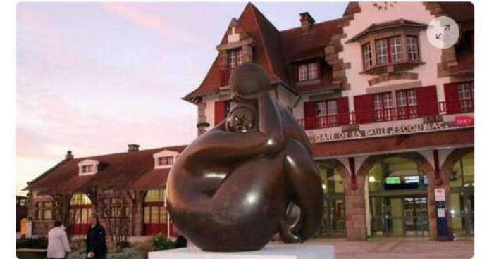
La sculpture restera devant la gare.

Huit sculptures monumentales de Jiménez Deredia, artiste de renommée internationale né au Costa Rica, ont été exposées pendant trois mois en différents points de la ville de La Baule.