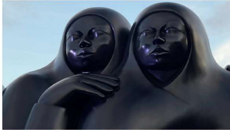
"Pareja" by master sculptor Jorge Jiménez Deredia is on display at Maurice A. Ferré Park for "A Bridge of Light," a free outdoor exhibition.