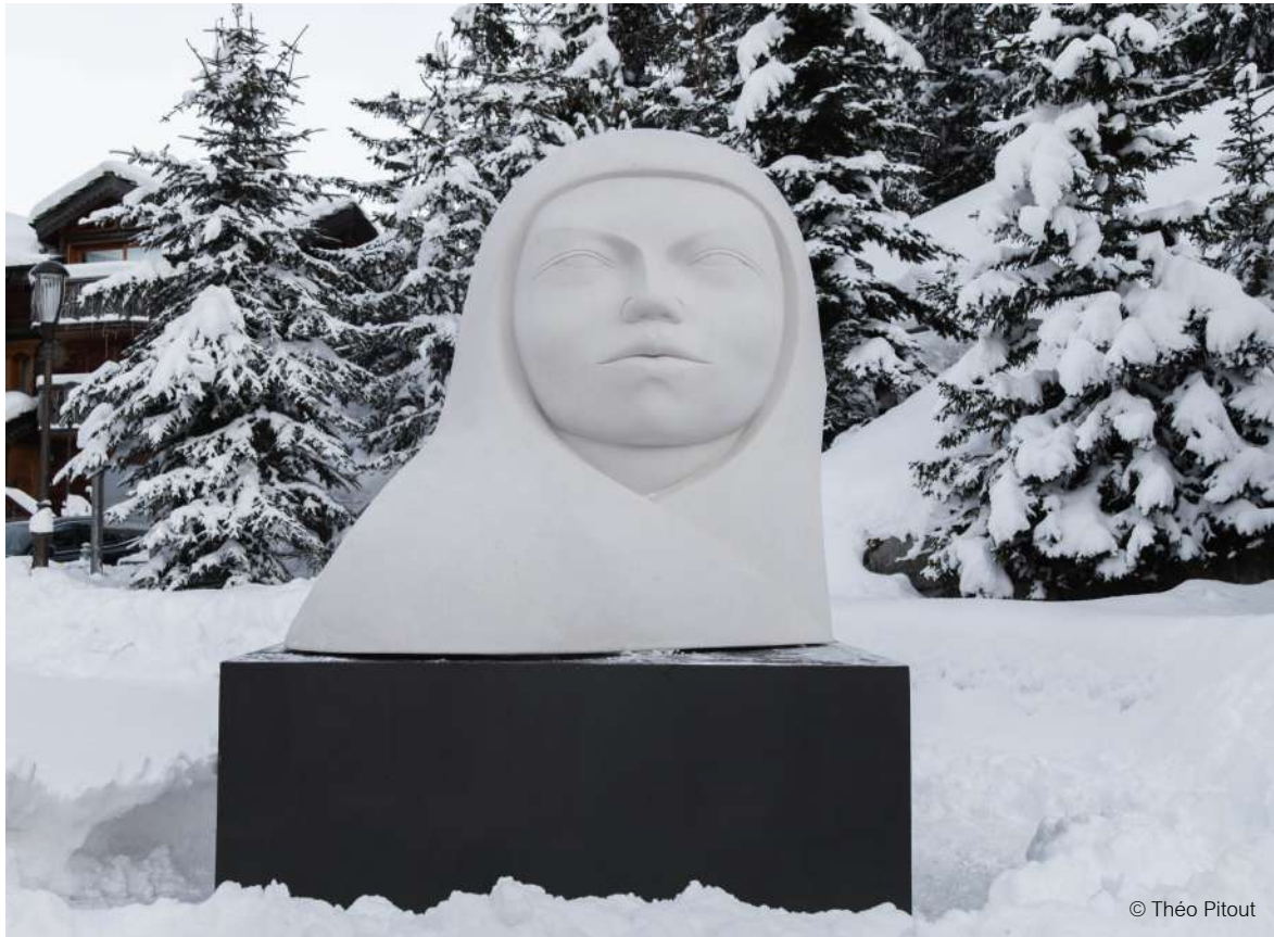
« INTENSIDAD »