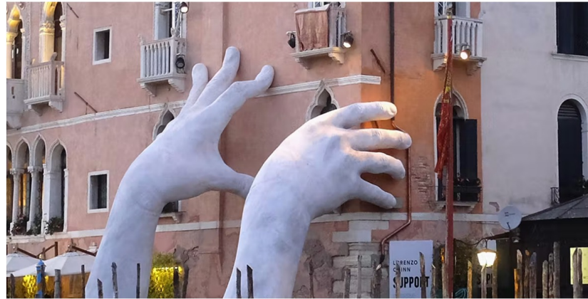
La sculpture « Support » de Lorenzo Quinn à Venise, le 19 mai 2017. L'oeuvre, avec deux mains tenant l'hôtel Ca Sagredo a fait partie de la 57e Exposition internationale d'art de la Biennale de Venise, et vise à mettre en évidence le changement climatique (détail), image © Adam Berry / Getty Images