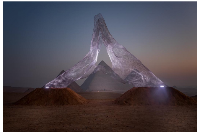
'Together' by Lorenzo Quinn.

The 'Forever is Now' exhibition features monumental artworks